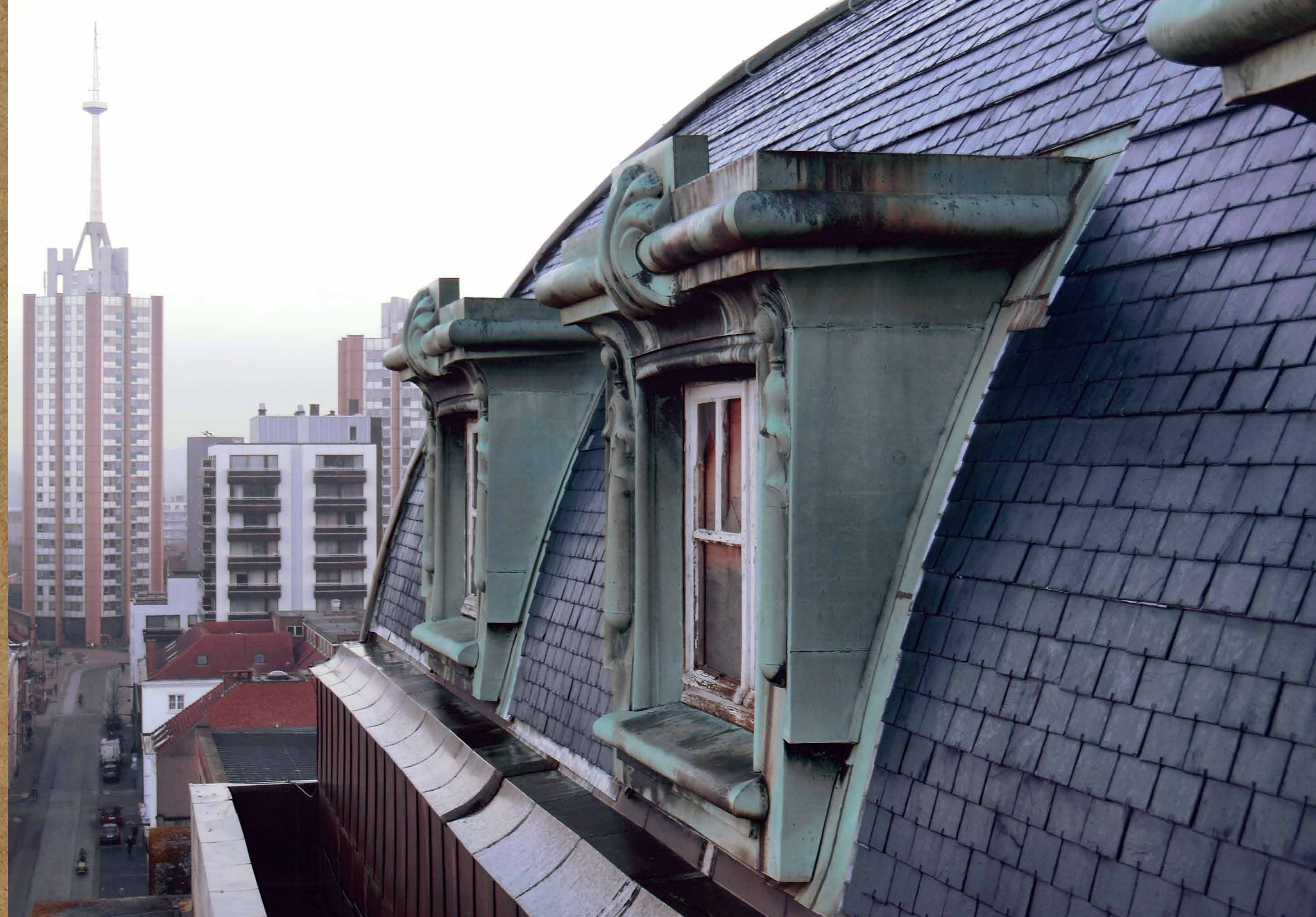
Leien dakbedekking en koperen dakkapellen vóór de restauratie.