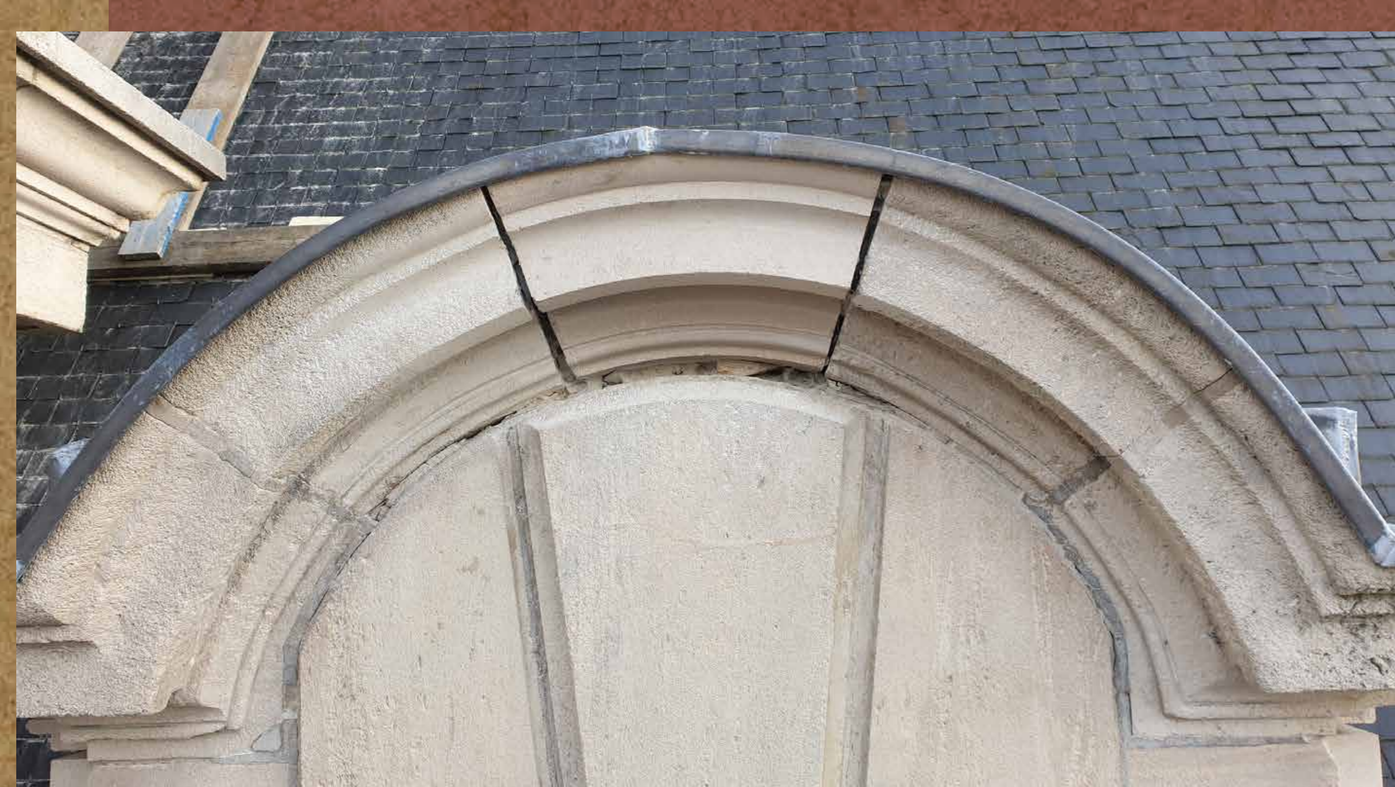
Vervanging natuursteen in dakkapel.

Op de zolder boven de 'salle des pas perdus' op de tweede verdieping werden de daken en ramen gedicht. Het glas in het plafond is vervangen door gelaagd glas voor een betere veiligheid. Om bevuiling van het beglaasde plafond te voorkomen, werd er een beschermkoepel over geplaatst.