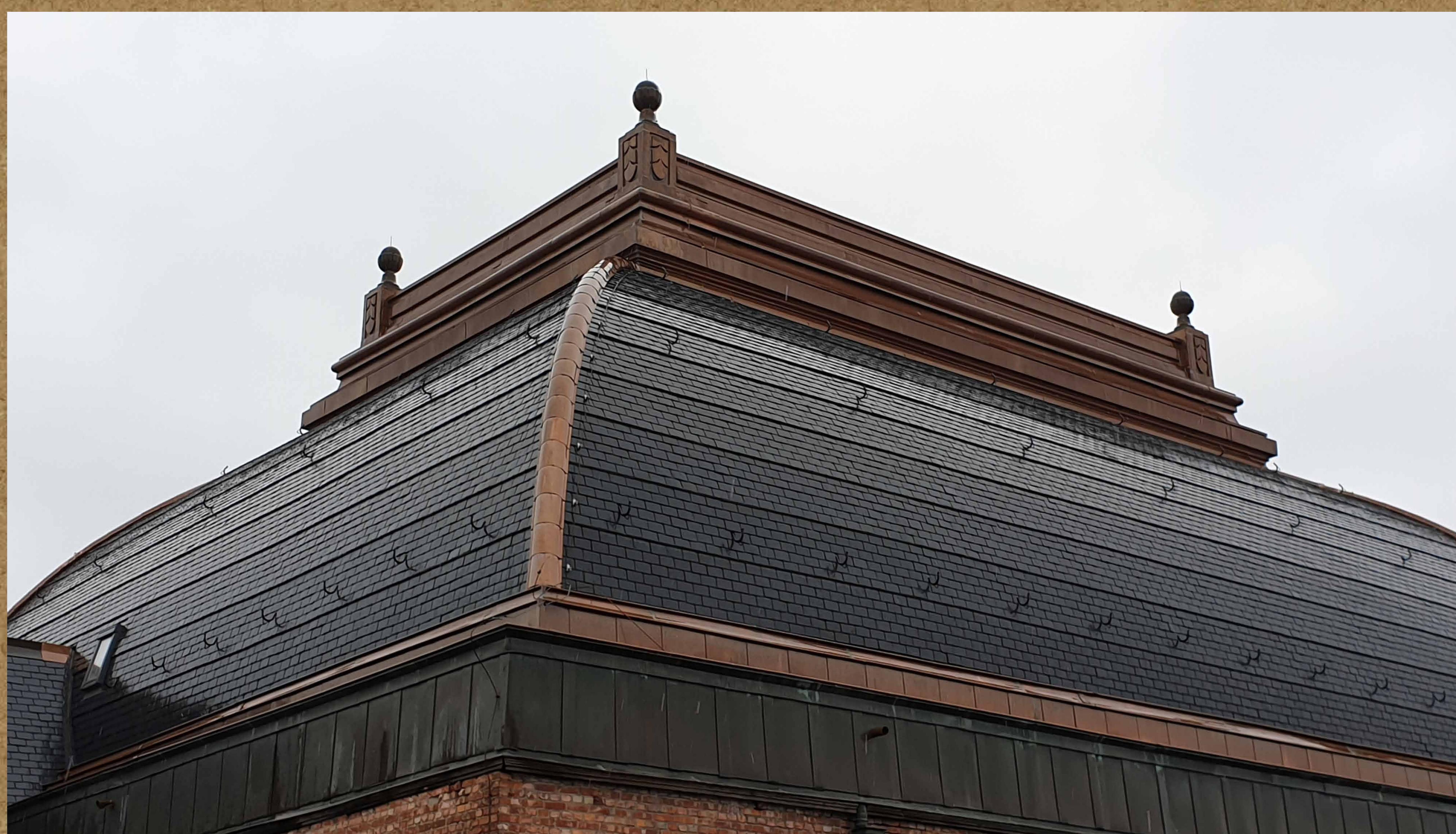
Nieuwe koperen bekroning koepel.