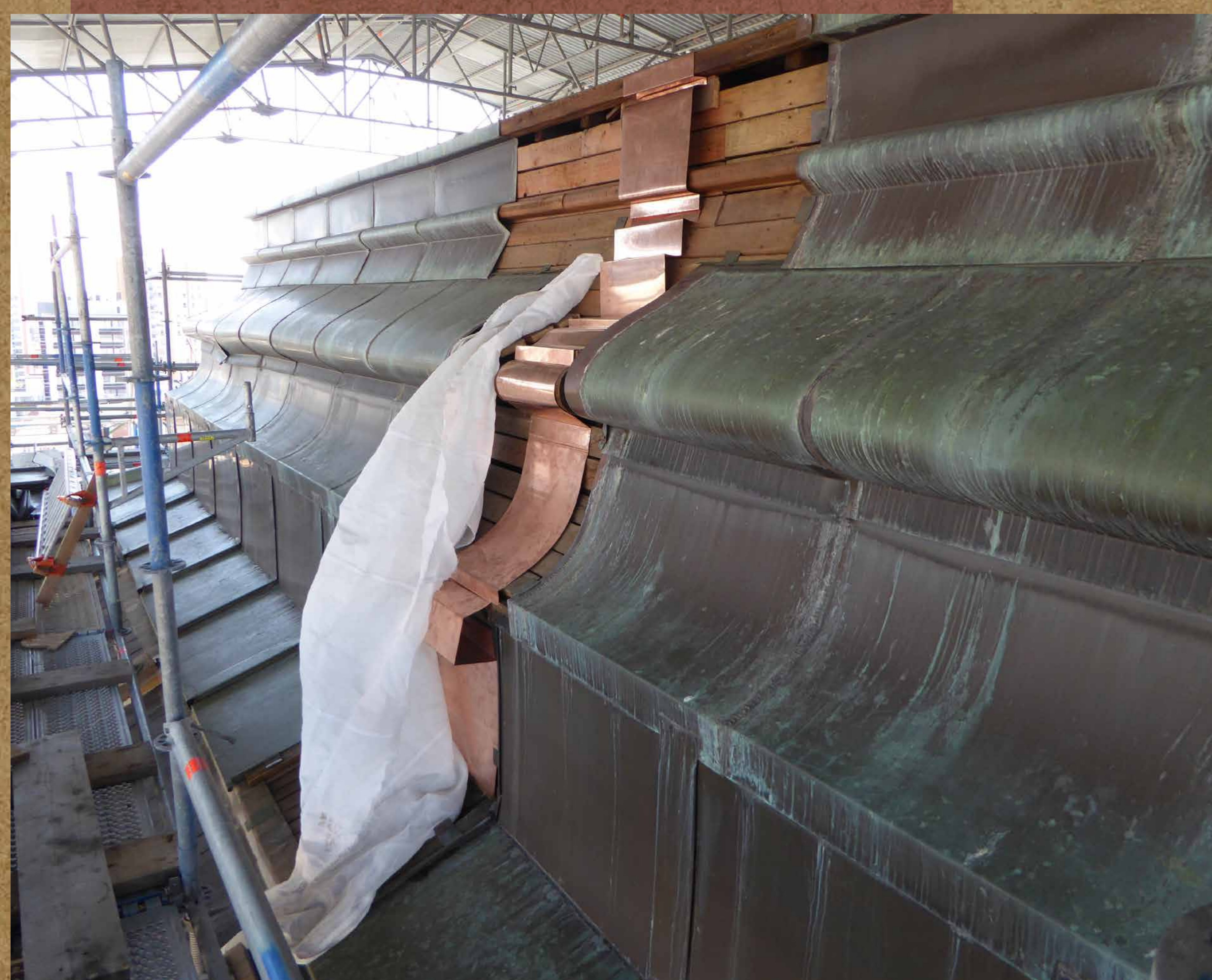
Oude en nieuwe koperen bekroning koepel.