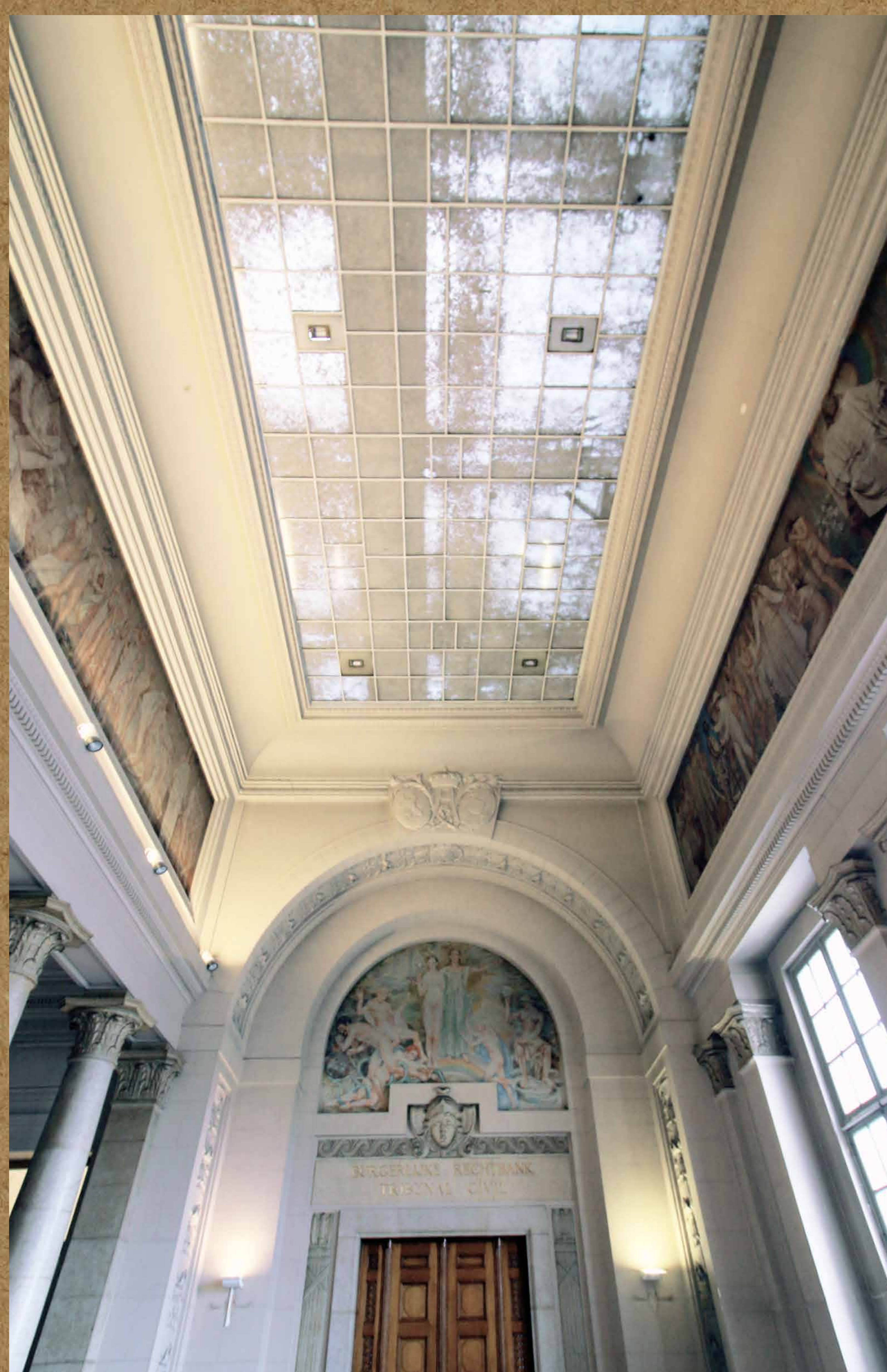
Het bevulde glazen plafond in de 'salle des pas perdus'.