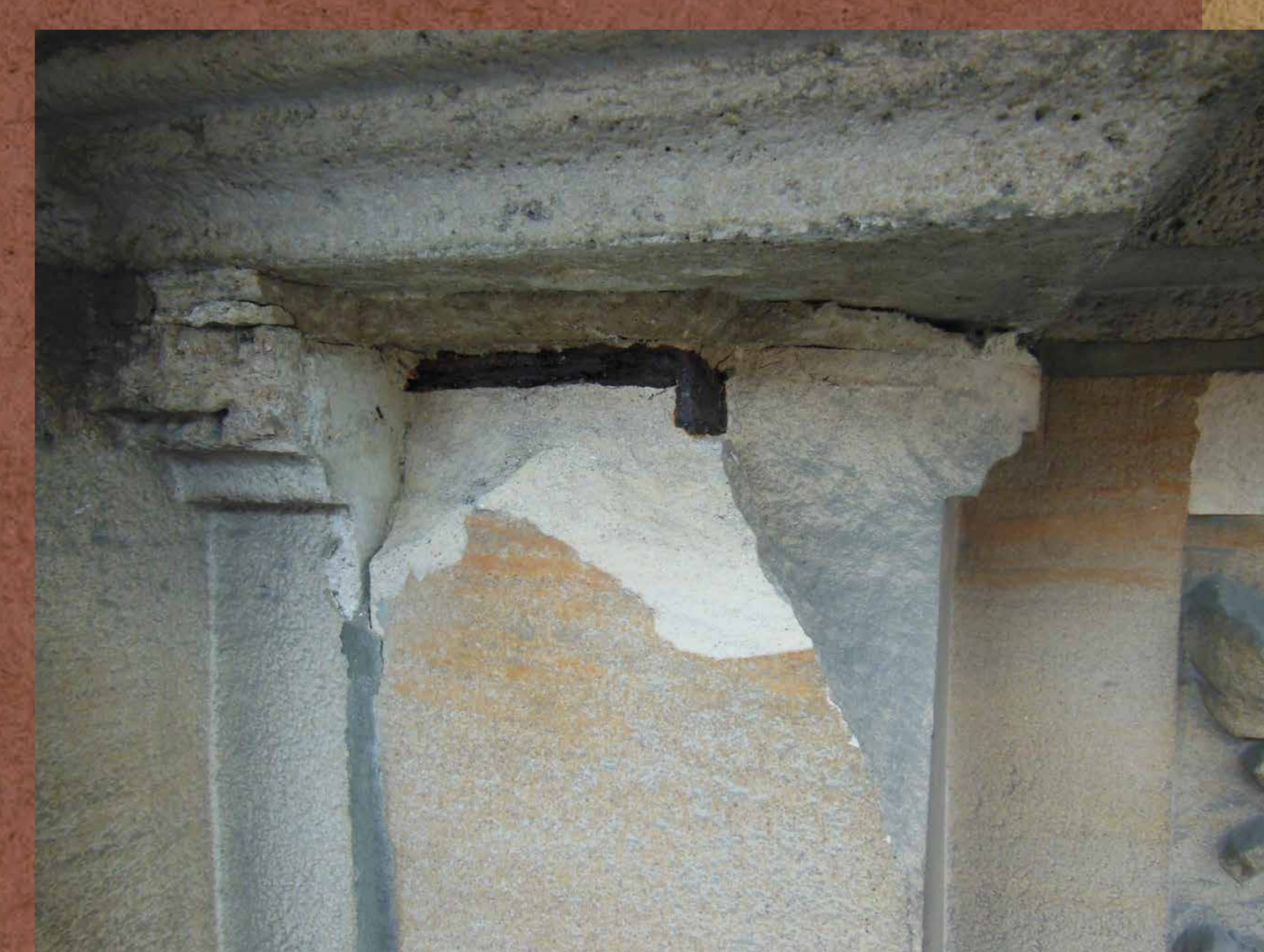
Verroeste verankering van de natuursteen.