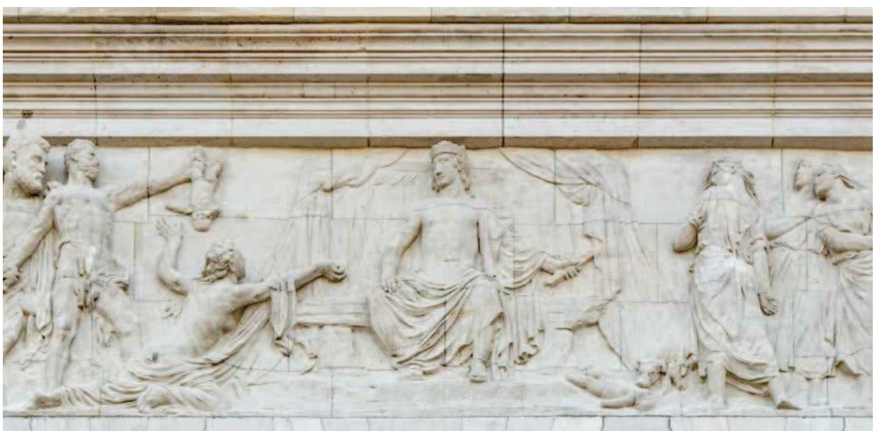
▲ Detail van het middentaferel van het centraal gevelreliëf.

het kind te laten leven. Ze strekt haar rechterhand uit naar het kind dat de beul aan één been vasthoudt, klaar om het bevel uit te voeren.