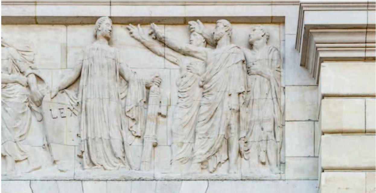
▲ Detail van het rechttafereel van het centraal gevelreliëf.

Een andere rechtsbron staat rechts afgebeeld: een vrouw steunt met een hand op een steen waarop het woord 'LEX' staat, een verwijzing naar het geleerde, op schrift gestelde wettelijke recht. In haar andere hand houdt ze een fasces, een bundel van roeden, gebonden met linten rond de steel van een bijl. Dit zinnebeeld van staatsgezag staat symbool voor de macht tot uitvoering van vonnissen. De fasces duikt ook elders in de decoratie nog regelmatig op.