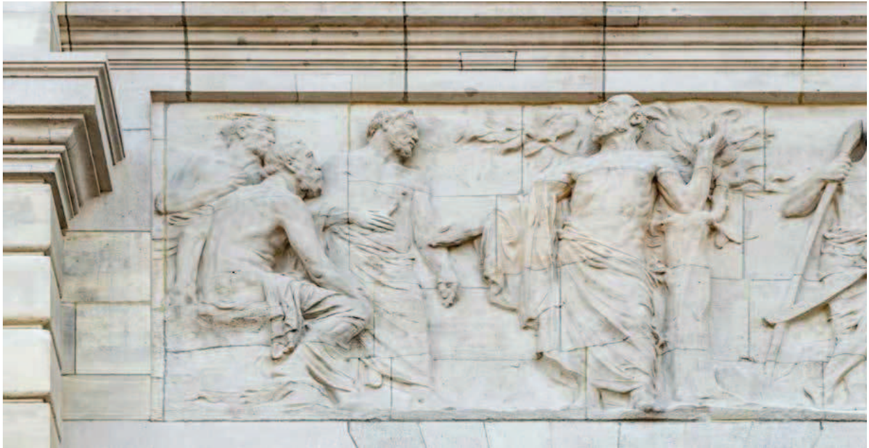
▲ Detail van het linkertafereel van het centraal gevelreliëf.

Dit tafereel is geflankeerd door twee andere voorstellingen van rechtspraak. Links is een groep mannen bijeengekomen nabij een gerechtsboom, de publieke plaats waar de gemeenschap, vertegenwoordigd door de oudsten, recht spreekt. Dit is een verwijzing naar het aloude ongeschreven gewoonterecht, dat zich legitimeert door de langdurige en herhaaldelijke toepassing van gebruiken binnen een gemeenschap die deze traditie als dwingend en normerend ervaart en mondeling overdraagt.