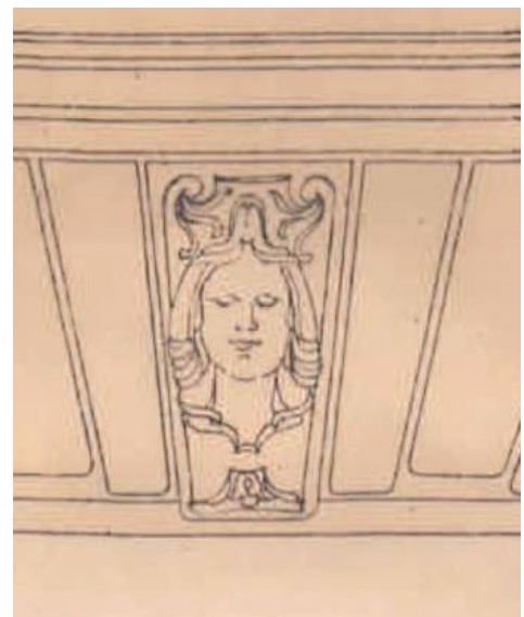
▲ Details uit plan met ontwerp van de voorgevel van het Leuvens gerechtsgebouw, Oscar Francotte, 30 september 1922. Collectie Rijksarchief Leuven.