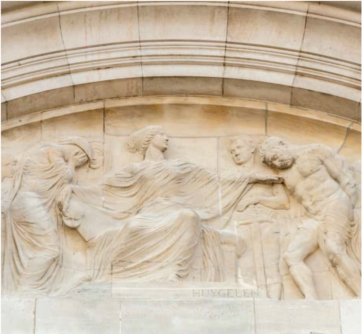
▲ Reliëf in de rechterhoekrisaliet van de voorgevel, 'Recht', Frans Huygelen, 1927.

In de rechtse beeldengroep strekt een tronende vrouw straffend en oordelend haar hand uit naar een gebogen mannenfiguur, met links van haar treurende figuren. Achter de veroordeelde roept de figuur van man met zwaard de strafuitvoering op.