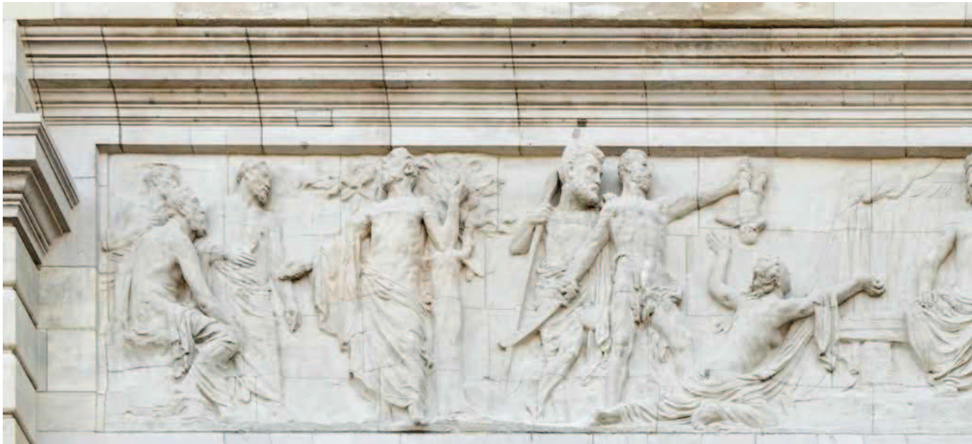
▲ Centraal gevelreliëf, 'Salomons oordeel', Egide Rombaux, 1927.

Verspreid over de voorgevel zijn drie reliëfsculpturen aangebracht. De voorstelling 'Salomons Oordeel' van Egide Rombaux siert het middengedeelte. Het tafereel staat symbool voor de rechtvaardigheid van de rechtspraak. Het is een moraliserend voorbeeldverhaal, een exemplum justitiae , van een na te volgen menselijk oordeel, dat rechters aanspoort goed recht te spreken.