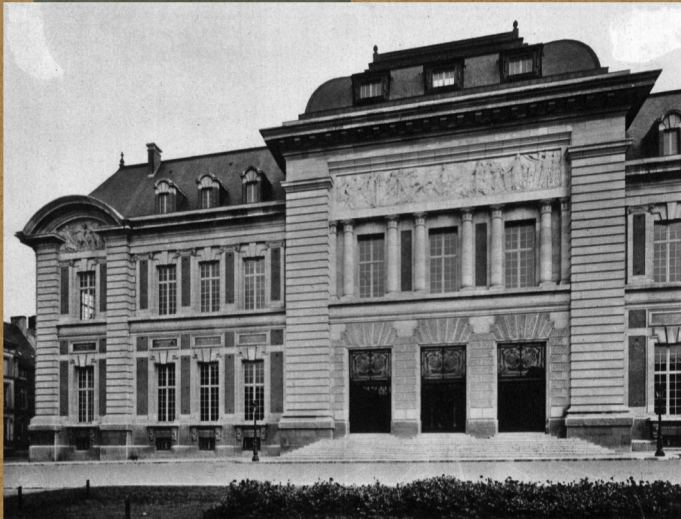
Foto van een deel van de voorgevel van het Leuvens gerechtshofgebouw. [1930].