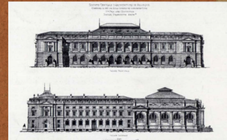
In 1883 behaalt Francotte de tweede prijs van de Société centrale d'architecture de Belgique voor een ontwerp van de gevels van een hogeschool voor architectuur. L'Emulation , 9/7, 1884, planche 20-21.