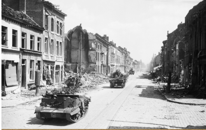
Britse tanks rijden door Leuven op 14 mei 1940.