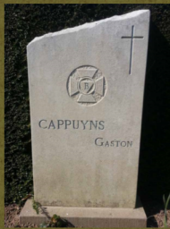
Grafsteen van Gaston Cappuyns, Stadsbegraafplaats Leuven. Foto Marcel Rosvelds, 2013.