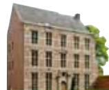
ZWB Museum Halle

www.servais-vzw.org Beertsestraat 45, 1500 Halle (Belgium) +32 (0)499 33 51 51 peter@servais-vzw.org